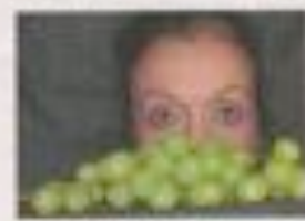
GASTRO-TEATRO. MICROTEATRO POR DINERO.

Por segundo año consecutivo, la ciudad de Madrid acoge el Gastrofestival, una iniciativa organizada por el Ayuntamiento de Madrid en colaboración con la dirección de Madrid Fusión. Gracias al éxito de la edición de 2010, este año se amplía su duración a dos semanas: del 24 de enero al 6 de febrero. Las actividades son numerosas y hay mucho donde elegir. Por un lado, lo que han llamado experiencias sensoriales, que implica tiendas espe-