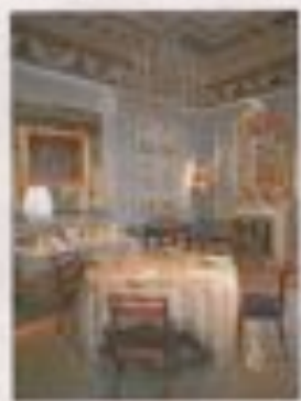
BUENAS FORMAS. EL MUSEO DEL ROMANTICISMO.

Tampoco alguno de los más señeros museos del Foro será ajeno a la propuesta. El Thyssen, el Museo del Romanticismo, el Sorolla o la Fundación Lázaro Galdiano han peregrinado recorridos especiales, conferencias, juegos pensados para niños y un sinfín