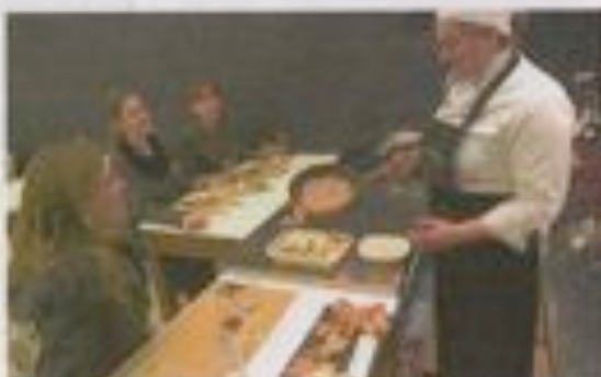
CLASES Y DEGUSTACIONES. «ACADEMIA DEL GUSTO».

Bajo el epígrafe gastronomía, la gastronomía llegará al cine, el teatro, la pintura o los libros. Del Séptimo Arte se encargará la Filoteca Española, en el Cine Doré, que del 25 al 30 de enero (2,50 euros por sesión) proyectará títulos tan emblemáticos como Ratatouille , Entre copas o Gracias por el chocolate . Por cuatro euros (incluyendo un mini cóctel) se podrá asistir a microgastroteatro o, lo que es lo mismo, cinco microrepresentaciones de 15 minutos puestas en escena por