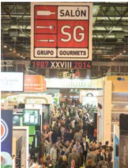
Ambas ferias han cumplido las expectativas de convocatoria de público y empresas

Las cifras de ambas citas dan idea de su magnitud. La décimo octava edición del Salón de Gourmets congregó en Iferma a 1.164 expositores de 20 países diferentes que mostraron 1.090 novedades y más de 30.000 productos de todo el mundo. Además de los espacios dedicados al aceite, vino, conservas, queso y dulces, nuevas actividades como la primera Beer Master Session, en la que se midió la habilidad de los tiradores de cerveza, o la Liga del 99, orientada al mundo del vino. Reclamamos que dan una vuelta de