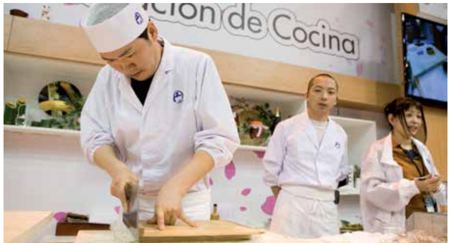
Japón ha sido el país invitado en Gourmets, mostrando alimentos y platos autóctonos

tuerca al formato de esta feria que logró un total de 79.959 visitas (+ 2,1% respecto a la edición anterior).